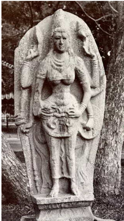
Gambar 1. Arca Durga dari Anuradhapura, India Abad ke-10

Kedua arca Durga (arca Durga India dan Jawa) digambarkan sebagai sosok dewi yang cantik oleh sang seniman pembuatnya, tetapi tetap hasil karya keduanya terasa berbeda. Pengarcean Durga yang merepresentasikan