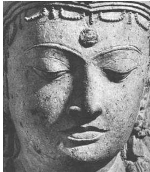
Gambar 4. Arca Prajnaparamita dari Candi Singasari

ideal seorang perempuan India diibaratkan sebagai mata anak kijang sehingga mata perempuan India cenderung digambarkan secara penuh seperti mata kijang (Gambar 3).