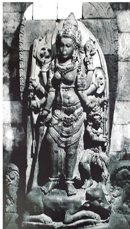
Gambar 2. Arca Durga dari Candi Prambanan, Jawa Tengah Abad Ke-9/10

perempuan India cenderung digambarkan dengan pinggang yang besar, sedangkan pengarcean perempuan Jawa memiliki pinggang yang tidak terlalu besar (Gambar 1 dan 2). Bahkan, masyarakat Jawa cenderung menghindari perempuan berpunggung lebar mengingat perempuan berpunggung lebar cenderung dianggap sudah melakukan hubungan seksual sehingga dianggap bukan perawan suthi yang baik untuk dinikahi. Menurut Claire Holt (Holt, 2000), wanita Jawa memiliki pinggul yang lebih sempit daripada yang dimiliki oleh wanita India. Para seniman Jawa tidak memahat pinggul yang melengkung lebar berlanjut ke paha yang panjang dan besar di bawah pinggang yang sangat ramping. Meskipun demikian, hal itu tidak mengurangi daya tarik seksualnya.