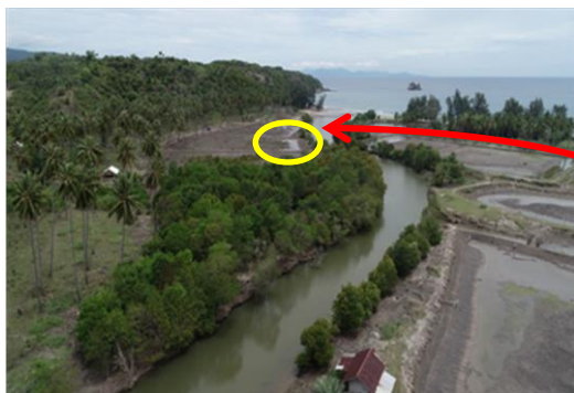
Gambar 4. Pantai Lubuk dilihat dari Udara.