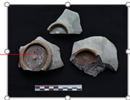
Gambar 3. Pecahan Keramik dan Keletakannya di Pantai Lhock Cut.