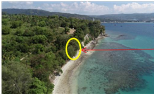
Gambar 2. Pantai Lhok Cut Dilihat dari Udara.

Keramik, tembikar, dan kaca banyak ditemukan pada permukaan tanah, di dalam area benteng, sekitar makam, Pantai Lhok Cut hingga tebing pantai. Sebagian besar keramik berasal dari abad 13--14. Adapun tembikar berupa jenis tembikar kasar dan halus. Tebing Pantai Lhok Cut di sebelah selatan Benteng Inong Balee terkikis sehingga terlihat lapisan karang, pasir, dan tanah. Kedalamannya 4 m dari atas tebing, terlihat pecahan keramik dan tembikar dalam jumlah yang berlimpah, terkonsentrasi dengan padat (Gambar 3). Meskipun di kedalaman tebing, ditemukan konsentrasi keramik dan tembikar dalam jumlah banyak, tetapi pada bagian atas permukaan tebing tidak dijumpai temuan fragmentaris apa pun. Situasi Situs Pantai Lhok Cut tampak dari udara, terlihat pada Gambar 2 sebagai berikut.