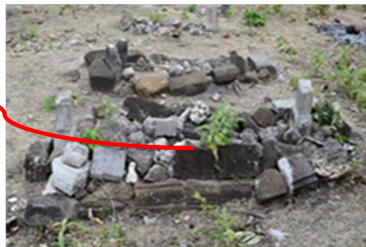
Gambar 5. Makam Sultan Muhammad Sulaiman dan keletakannya di Pantai Lubuk.