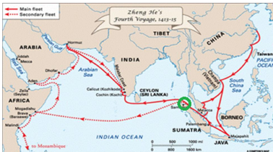
Gambar 6. Peta jalur pelayaran Cheng Ho dari Cina ke arah barat: Cina- India-Arab dan sebaliknya, melalui jalur laut, melewati Selat Malaka, abad ke-15. Lokasi Situs Pantai Lhok Cut dan Lubuk tanda lingkaran warna hijau.

yang telah kuat. Nama-nama pedagang Arab di antaranya Soleyman dan Ibn Wahab dari Basra. Soleyman (Sulaiman) melakukan perjalanan pertama, adapun Ibn Wahab Basra melakukan perjalanan yang kedua pada abad ke-9 (Hirth and Rockhill, 1966). Keramik produk Cina sangat mahal dan langka di pasar Basra dan Baghdad. Pantai ujung utara Sumatra merupakan satu pelabuhan yang dilintasi dan disinggahi pedagang Cina dan Arab. Cheng Ho, Laksamana dari Cina sekitar awal hingga pertengahan abad ke-15 (tahun 1405--1433), melakukan tujuh kali ekspedisi pelayaran diplomatik dan perdagangan atas perintah masa Kaisar Yung Lu menuju ke lautan di sebelah barat dari Cina. Ekspedisi pelayaran Cheng Ho berlayar dari Nanking di Cina hingga daerah Timur Tengah dan sebaliknya selama tujuh kali. Nama-nama kota, pelabuhan yang disinggahi Cheng Ho dalam pelayarannya di antaranya adalah (1) Champa (Vietnam), (2) Malaka, (3) Palembang, (4) Jawa (Majapahit), (5) Aru, (6) Litai (Merudu/Pidie), (7) Samudera, (8) Nan-po-li/Nan-wu-li/Lambri, (9) Ceylon, (10) Calicut, (11) Hormuz, (12) dan Baghdad (Mills 1970). Nama Nan-po-li/Nan-wu-li/Lambri yang tertulis dalam catatan Ma Huan, sekretaris Cheng Ho abad ke-15, diduga kuat lokasinya berada di Pantai Lhok Cut dan Lubuk yang berada di kawasan Lamreh. Gambar ke-6 berikut merupakan peta yang menunjukkan jalur pelayaran dan nama-nama pelabuhan yang disinggahi ekspedisi Cheng Ho abad ke-15, termasuk Lambri atau Lamuri atau Lamreh (Schlegel, 1901; Fairchild n.d.)