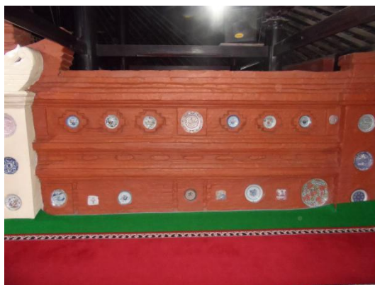
Gambar 5. Penempatan keramik pada dinding masjid.