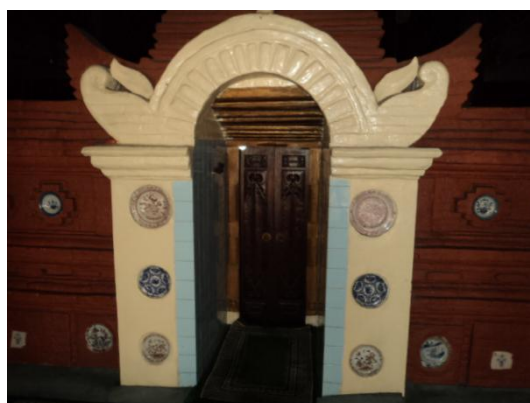
Gambar 6. Penempatan keramik di bagian pintu ruang utama (dilihat dari serambi masjid) (Sumber: Dokumen Bauty, 2013).

Secara kasat mata, terlihat bahwa pola penempatan keramik di Masjid Panjunan ini diupayakan sesimetris mungkin dengan jenis motif keramik yang sama. Selain itu, keramik yang digunakan sebagai motif hias terdiri atas dua bentuk geometris, yaitu bulat dan persegi. Akibatnya, keramik yang ada di Masjid Panjunan ini didominasi keramik piring, baik ukuran besar, sedang, maupun kecil, serta keramik mangkuk yang hanya sedikit ditemukan (Gambar 4, 5, dan 6).