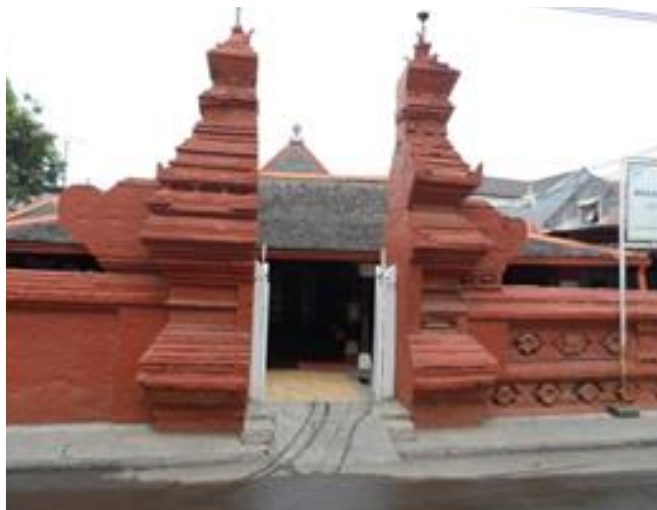
Gambar 1. Gapura depan Masjid Panjunan, Cirebon (Sumber: Dokumen Bauty, 2013).

Secara umum bangunan Masjid Panjunan memiliki denah persegi panjang yang dikelilingi oleh pagar yang terbuat dari bata merah. Pintu gerbang masjid berada di sebelah timur yang berbentuk Candi Bentar. Pada pintu gerbang tersebut terdapat suatu ornamen tambahan yang menyerupai sayap.