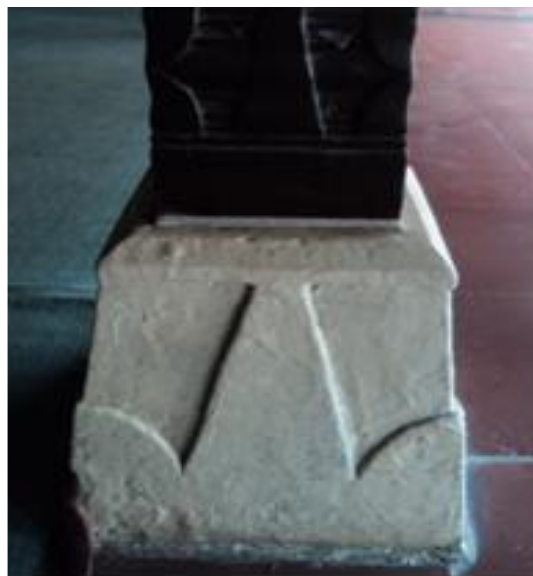
Gambar 2. Umpak bermotif teratai di Masjid Panjunan, Cirebon (Sumber: Dokumen Bauty, 2013).

bawah terdapat umpak yang terbuat dari batu. Umpak ini memiliki bentuk hias seperti bunga teratai (Gambar 2).