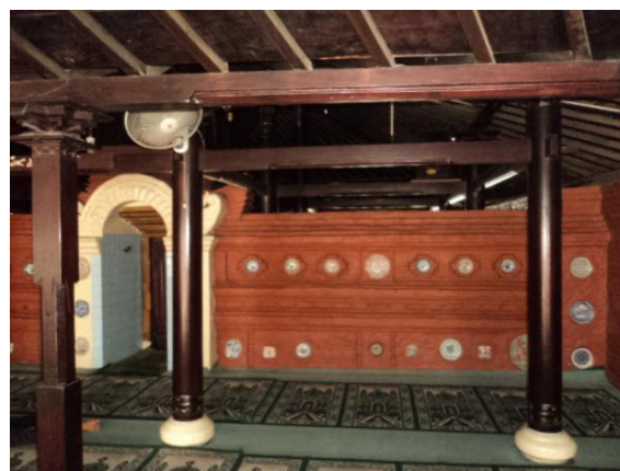
Gambar 4. Penempatan keramik pada bagian serambi masjid (Sumber: Dokumen Bauty, 2013).

Hiasan keramik yang ada di Masjid Panjunan ditempatkan di dua area, yaitu bagian serambi dan bagian ruang utama masjid. Keramik-keramik tersebut ditempelkan pada bagian dinding dan pilar masjid. Penempelan keramik ini diperkirakan menggunakan media tanah liat sebagai bahan yang sama dengan dinding masjid. Secara umum, keramik yang ditempelkan pada dinding disusun dengan pola dua baris atas-bawah, sedangkan keramik yang ditempelkan pada bagian pilar disusun menurun (kolom).